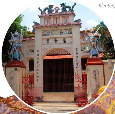
Klenteng Tjoe An Kiong